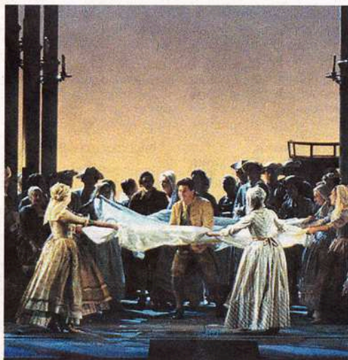
'Manon Lescaut', de Puccini, dirigida por Liliana Cavanni.