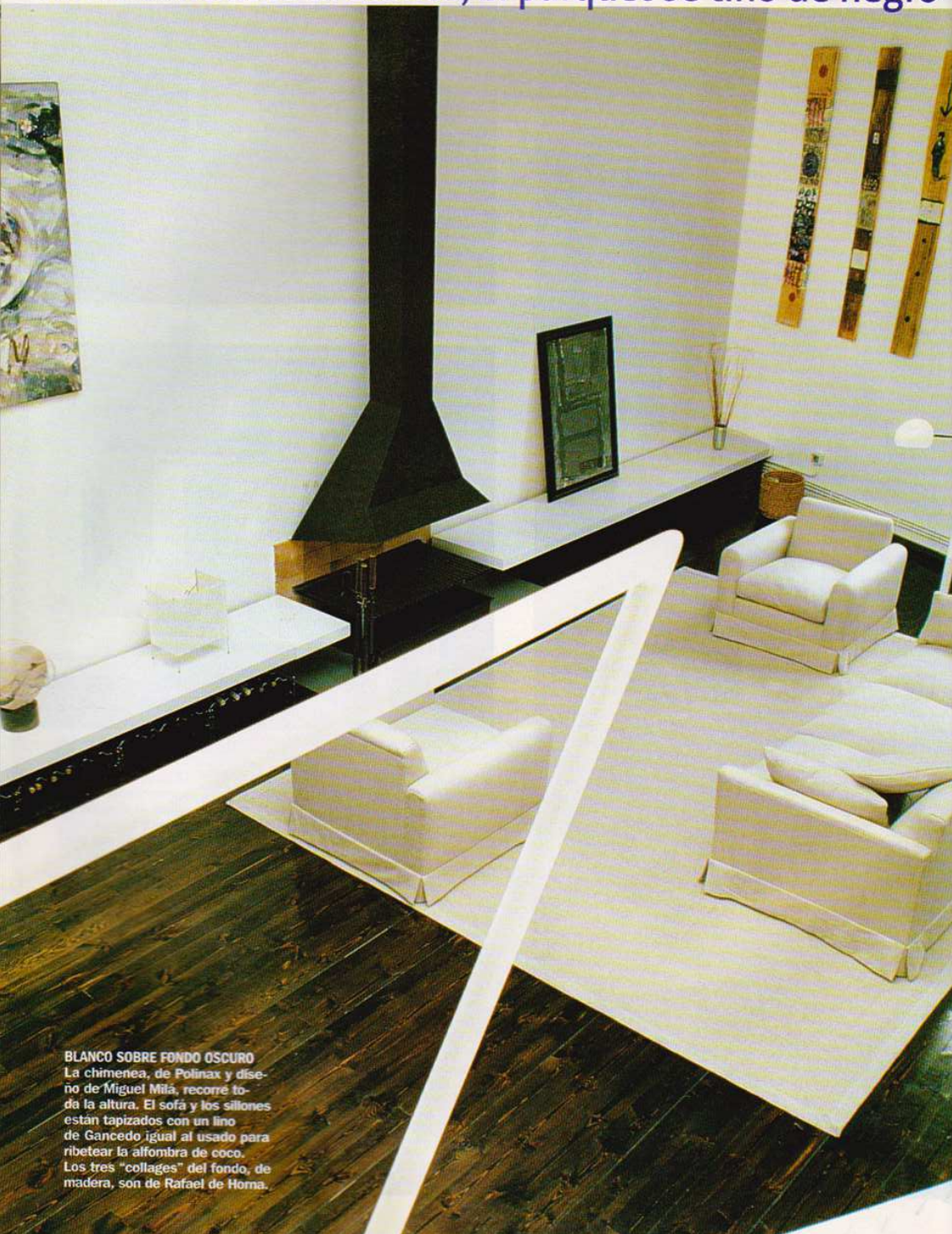
BLANCO SOBRE FONDO OSCURO La chimenea, de Polinax y diseño de Miguel Milá, recorre toda la altura. El sofá y los sillones están tapizados con un lino de Gancedo igual al usado para ribetear la alfombra de coco. Los tres "collages" del fondo, de madera, son de Rafael de Horna.