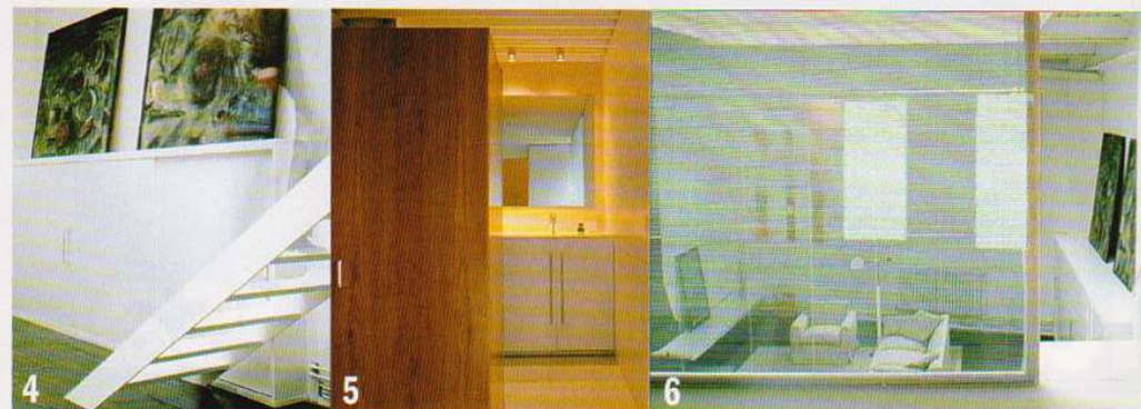
4 Frente de armarios. La parte inferior de la pared frente a la chimenea es toda un armario de madera lacada, con puertas correderas; además, sirve de apoyo a dos cuadros de Santiago Bueno . La escalera, de hierro pintado, es muy liviana, para no quitar luz. 5 Armario-tabique. El dormitorio y el cuarto de baño comparten el espacio del altillo, separados tan sólo por un gran armario de madera de cerezo, hecho a medida, con la parte posterior —la que da al baño— recubierta de azulejos. 6 Pared de cristal. Para no privarle de luz natural, la pared que da al salón es de cristal securizado, con unas persianas de lamas metálicas, Cortinova , que gradúan la claridad e independizan este espacio.